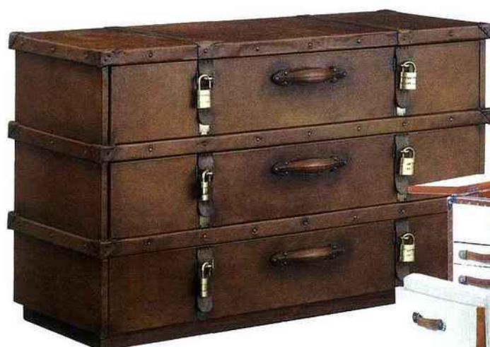
Pantalonnière Madras servant de commode et chevet, Starbay . 2.965 €

La malle de voyages devient un rangement facétieux avec ses nombreuses utilisations. Le bar nomade remplira aisément son office en accueillant bouteilles, verres et ustensiles de sommelier, dans les multiples compartiments prévus à cet effet. Peu encombrante, la malle-dressing offrira un espace de rangement conséquent avec penderie et tiroirs, sans oublier les miroirs, dans un luxe d'équipement. Parfois la malle se refermera complètement, prête à embarquer, ce qui lui donnera une allure de grande voyageuse plutôt plantureuse et présentera en même temps un réel avantage, en termes de gain de place. Une invitation aux voyages... N'attendez plus, faites-vous la malle !