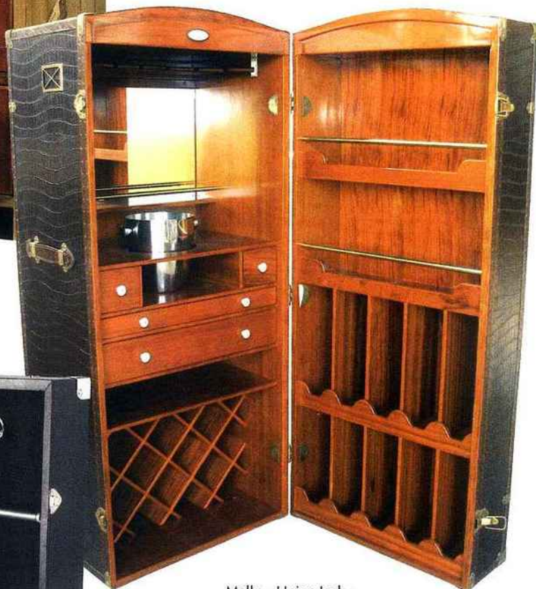
Malle - bar croco noir Nairobi, Starbay. 3.320 €