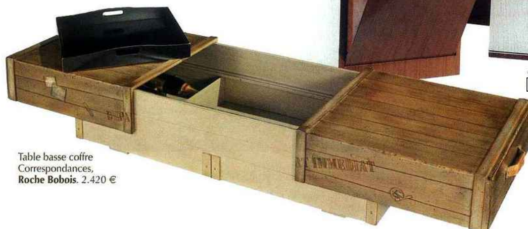
Table basse coffre Correspondances, Roche Bobois . 2.420 €