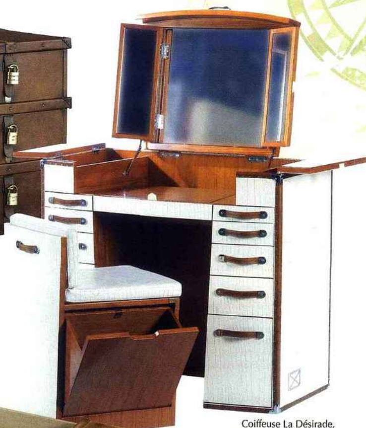
Coiffeuse La Désirade, Starbay 3.930 €