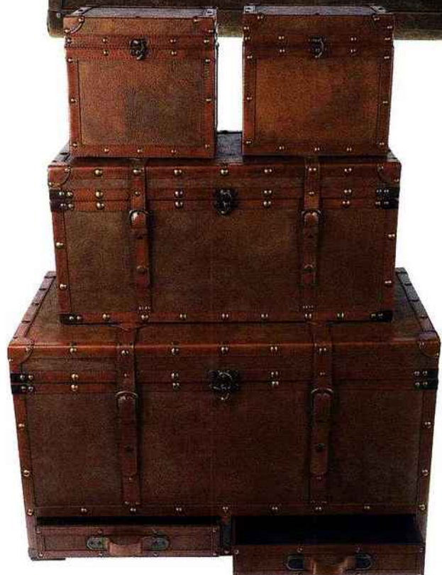
Coffres en simili cuir, Truffaut . À partir de 29,95 €