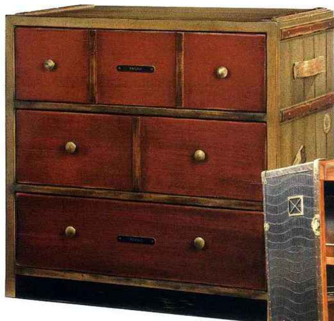
Commode Peintre, Roche Bobois. 2.200 €