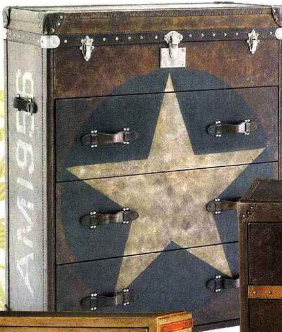
Malle à tiroirs en cuir Andrew Martin, Jules & Jim . 2.500 €