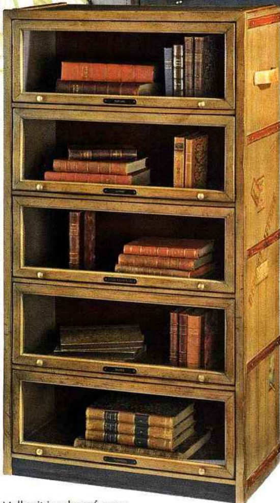
Malle vitrine de parfumeur Correspondances, Roche Bobois . 2.510€